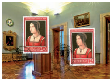
MK Spezial 266